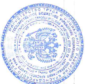
График работы библиотеки ГБУ СО КК «Терновский ПНИ» на 2024 год